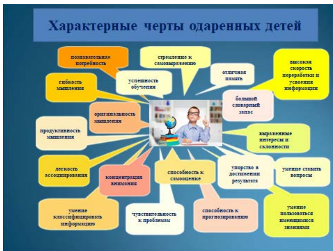
Рис. 1 Характерные черты одаренных детей.

Этот перечень можно дополнить следующими чертами: