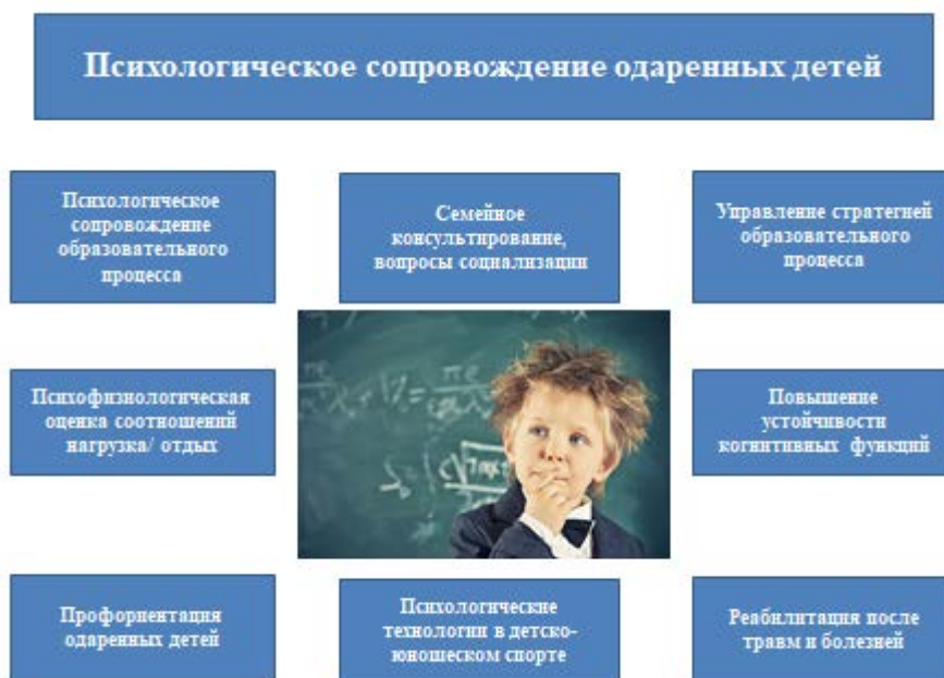
Рис. 2. Психологическое сопровождение одаренных детей

образовательных организациях (Концепция развития психологической службы в системе образования в Российской Федерации на период до 2025 года утверждена министром образования и науки РФ О. Ю. Васильевой 19 декабря 2017 г.), основные направления которого представлены на рис. 2.